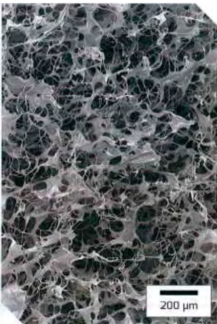
Imagen microscópica de la estructura porosa de HEMOTESE®.

No utilizar HEMOTESE® en pacientes con predisposición o conocida alergia al colágeno bovino.