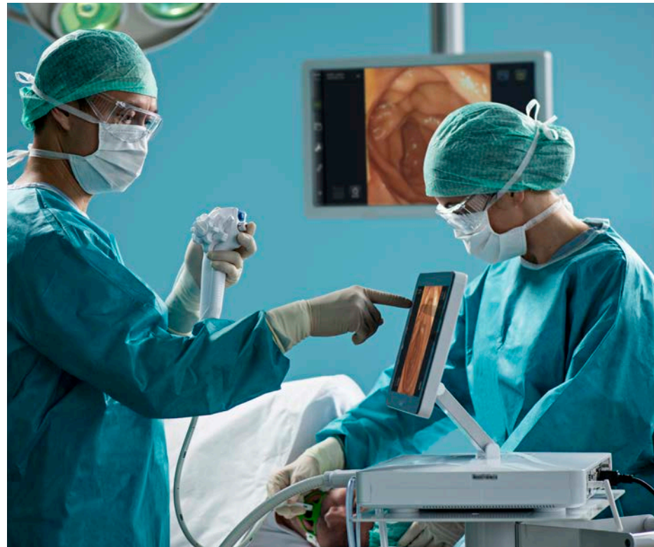
IMAGEN ENDOSCÓPICA EN TIEMPO REAL EN LA PANTALLA TÁCTIL INTEGRADA EN CUESTIÓN DE SEGUNDOS